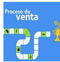
Control del proceso de ventas