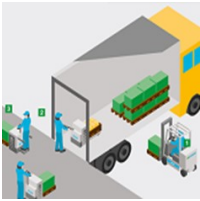
Control de recepción correcta de mercancías