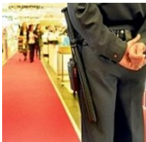
Control de rondines (fotografías, lugar)