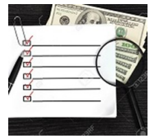
Control verificado de pagos