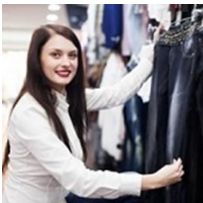
Control y reporte de actividades