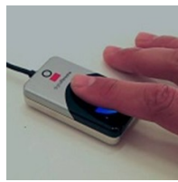
Control de asistencia de personal