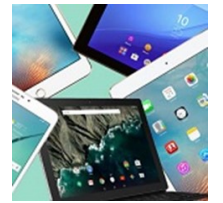
Control de activos (dispositivos móviles)