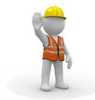
Control de riesgos