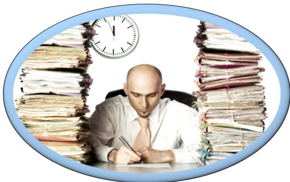
Procesos de papel

En cambio, los procesos digitales conllevan estandarización, control, medición del desempeño y monitoreo.